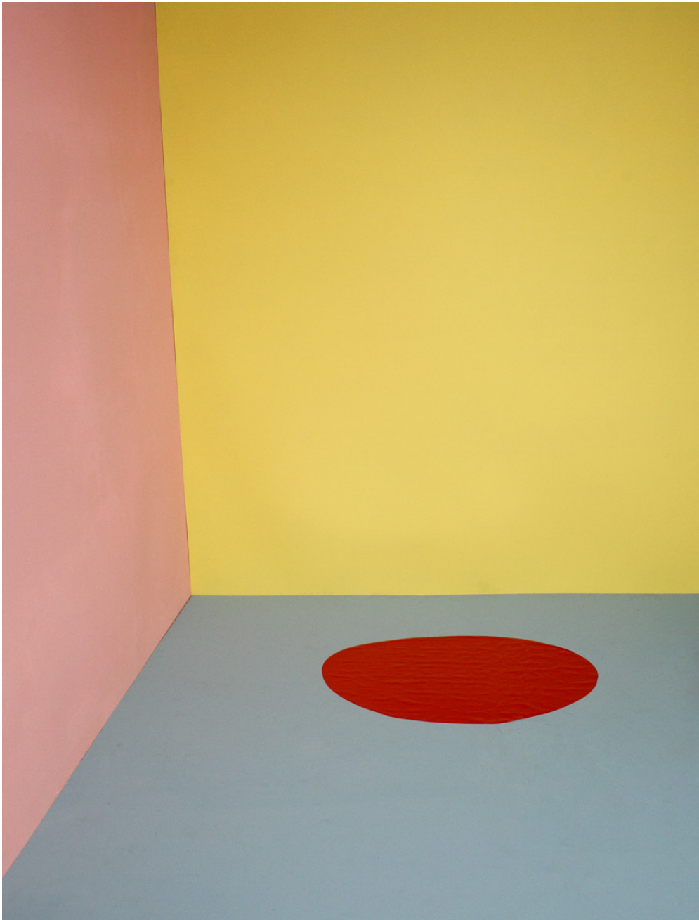
Delphine Chanet, Fil rouge , 2009 Tirage jet d'encre, 79,02 x 104 cm, © Delphine Chanet