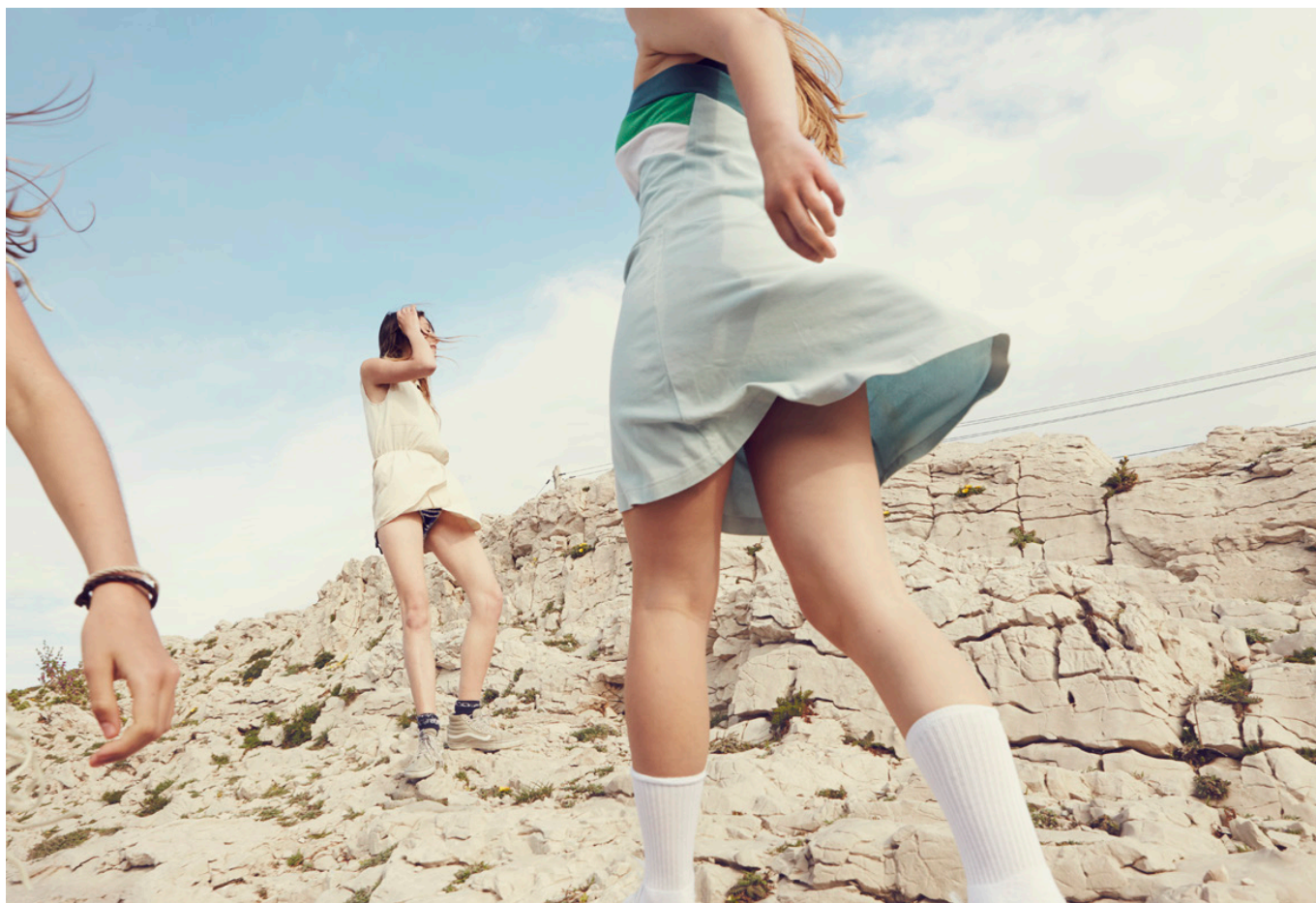
Delphine Chanet, Amélie , 2015 Tirage jet d'encre, 144 x 104 cm, © Delphine Chanet