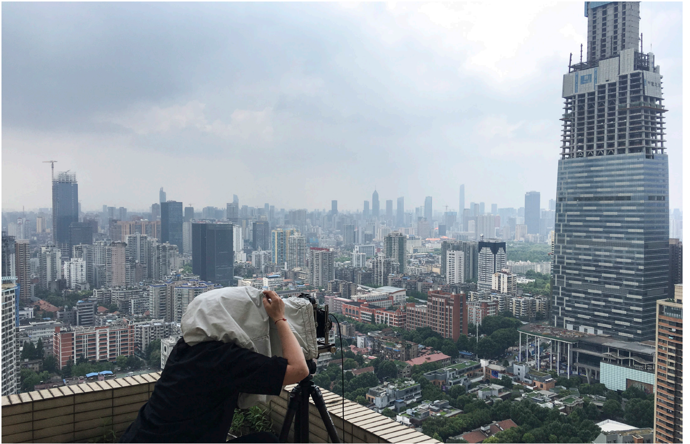
Sabine Delcour, prise de vue, Wuhan (province du Hubei), 2019