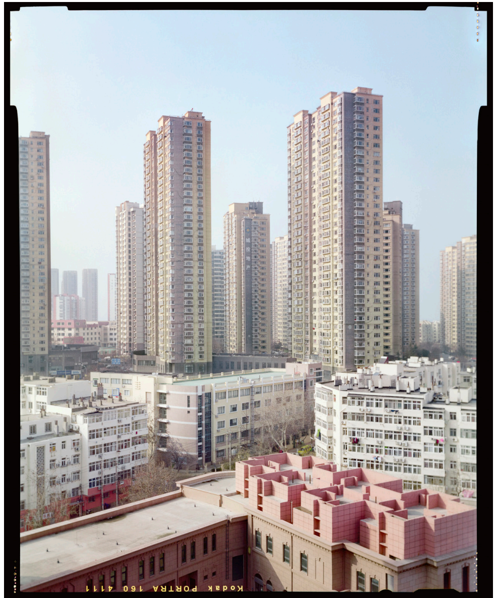
Sabine Delcour, New Way of Living , photographie 14 e étage, Qingdao, province du Shandong, Chine, 2020