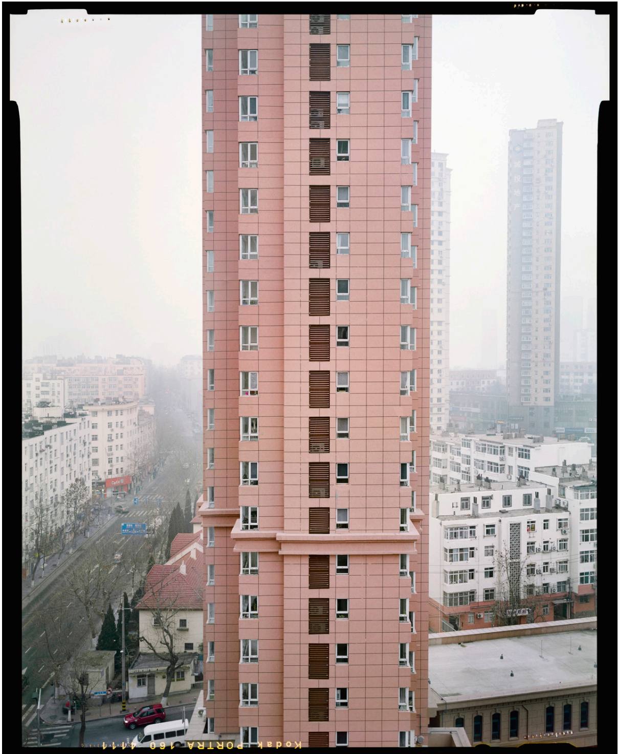
Sabine Delcour, New Way of Living , photographie 14 e étage, Qingdao, province du Shandong, Chine, 2020 © l'artiste