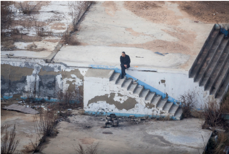
Sabine Delcour, New Way of Living, Sans titre Tirage pigmentaire, 2020 © l'artiste