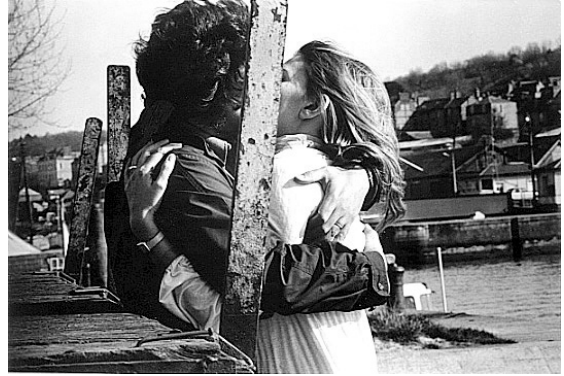
Denis Roche, Honfleur, le 12 avril 1971, Série Circulation dans les doutes, 1971. Collection Frac Aquitaine.

Publié aux éditions du Seuil en 1957, Mythologies est un recueil de 53 textes rédigés par Roland Barthes entre 1954 et 1956, au fil des mois et au gré des événements.