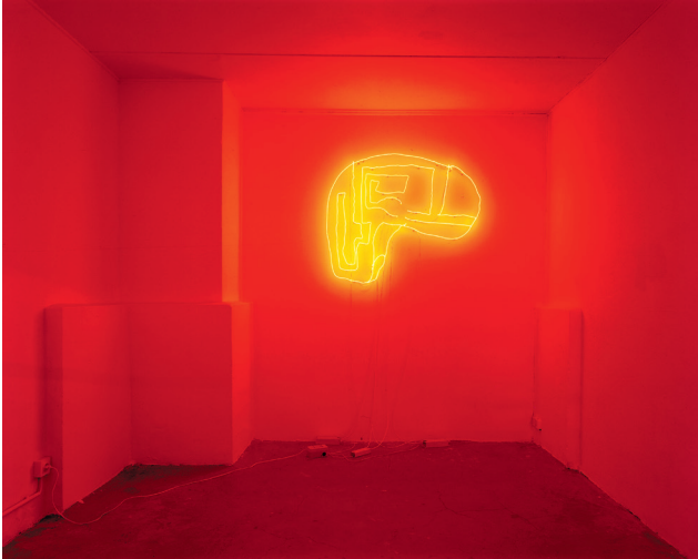
Claude Lévêque, Sans Titre , 1993. Collection Frac Aquitaine.