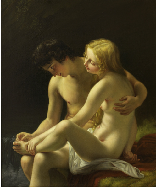
Louis Hersent (1777-1860), Daphnis et Chloé : Le Tireur d'épine