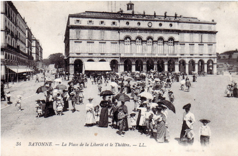
Bayonne – La Place de la Liberté et le Théâtre, carte postale. Collection Christian Prieur

À l'occasion des célébrations du Centenaire de l'écrivain (1915-1980), la Ville de Bayonne, La Petite Escalère et l'Université de Pau et des Pays de l'Adour s'associent pour proposer une série d'événements en hommage au grand intellectuel, essayiste et critique du XX e siècle que fut Roland Barthes.