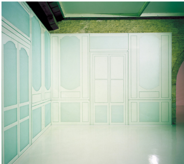
Pascal Convert, Appartement de l'artiste, empreinte , 1989. Collection Frac Aquitaine. © Adagp. Photo : F. Delpech

Lumières de Roland Barthes au Centre d'art image/imatge et au Frac Aquitaine est une invitation à découvrir, à travers l'art contemporain et la collection du Frac Aquitaine, la postérité théorique et esthétique d'un des penseurs les plus importants du XX e siècle.