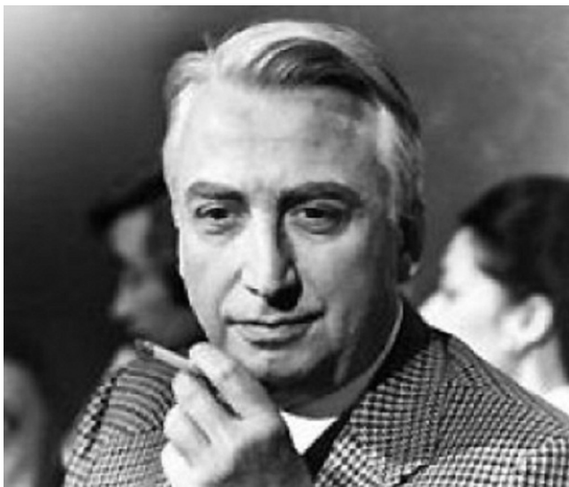
Portrait de Roland Barthes.

L'année 2015 est celle du Centenaire de la naissance de Roland Barthes (1915-1980). Ayant passé une partie de son enfance à Bayonne et enterré au Pays basque, à Urt, l'auteur est une figure du Sud-Ouest avec la particularité que son œuvre excède largement les frontières de cet ancrage territorial avec une portée nationale et internationale. Il convenait donc d'organiser une série d'événements culturels pour constituer un volet aquitain en lien et en complément d'une série de commémorations nationales, ainsi qu'une possible extension à l'étranger, en Corée notamment. À l'initiative du Frac Aquitaine, le programme connaîtra une résonance foisonnante puisque une dizaine d'opérateurs bordelais et aquitains se sont retrouvés pour composer un programme diversifié (exposition, colloque, festival etc.) de manière à susciter une actualité dense et riche depuis le printemps jusqu'à l'automne 2015.