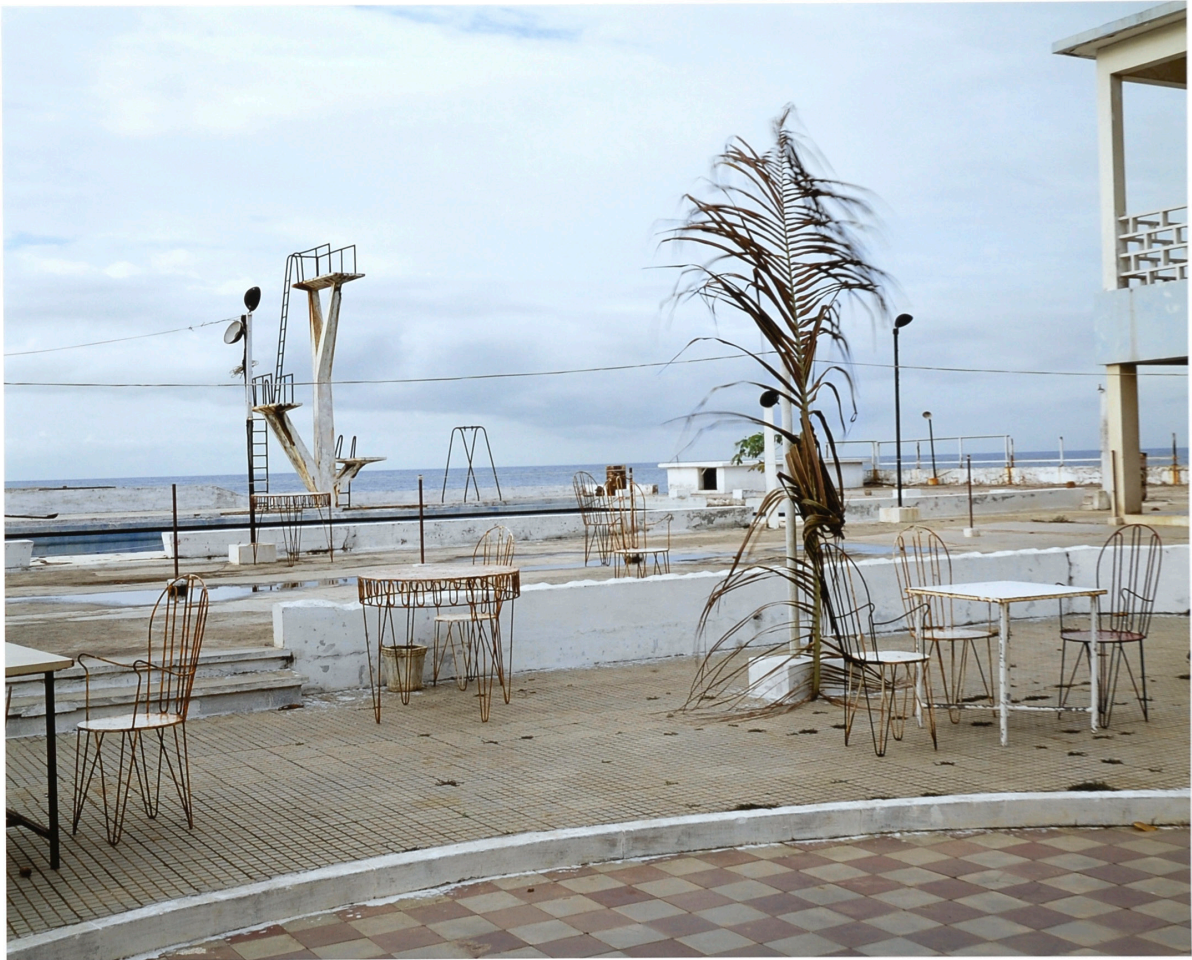
Sophie Ristelhueber La ligne de l'équateur , 2005 Sérigraphie