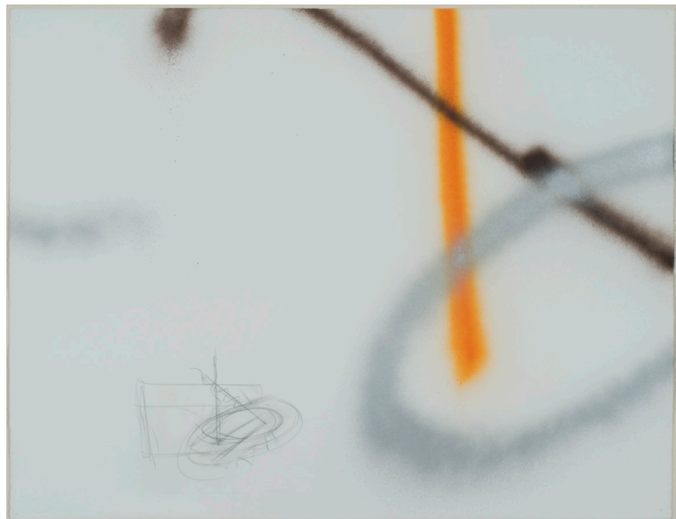
Peter Soriano Spray drawing 14 , 2007 Mine de plomb et peinture sur papier