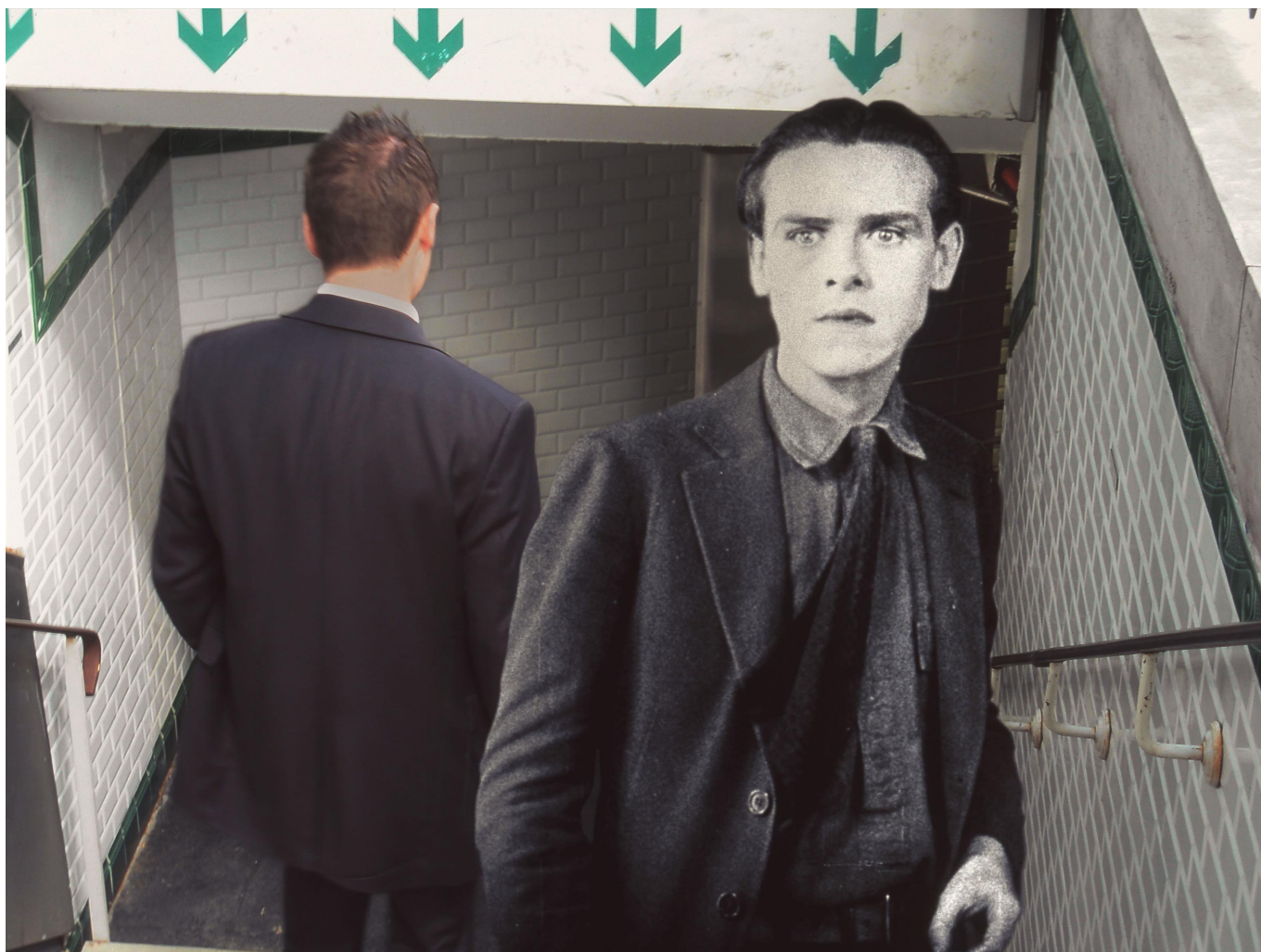
Sortie (série : Seuils ), 2008, Ilfochrome sur aluminium, 100 x 133 cm, © Éric Rondepierre