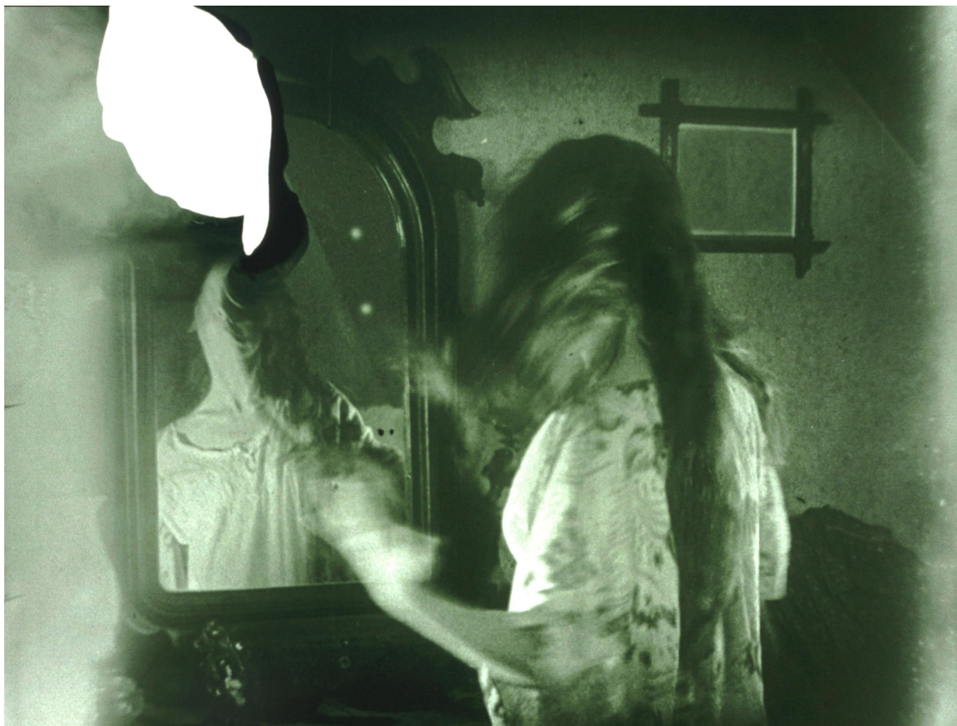
02314R (série : Moirs ), 1996 – 1998, l'fochrome sur aluminium, 76 x 100 cm, © Éric Rondepierre