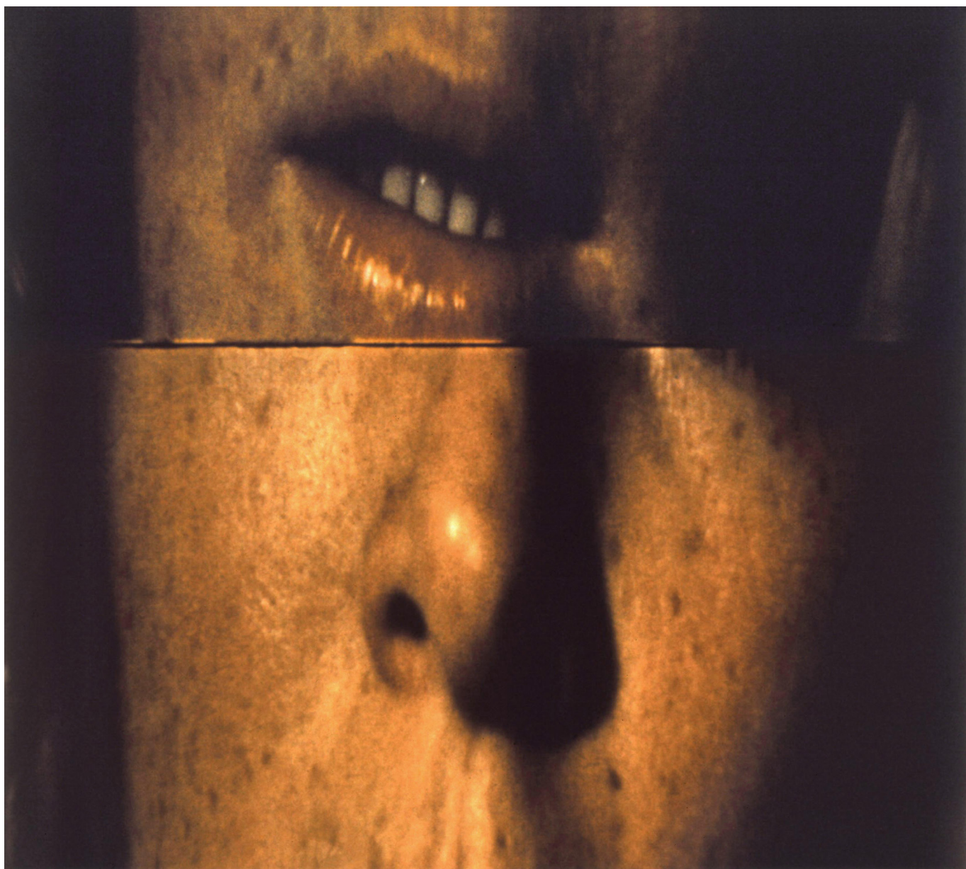
Chuchotement (série : Suites ), 1999 – 2001, Ilfochrome sous diasec, 103 x 113 cm, © Éric Rondepierre