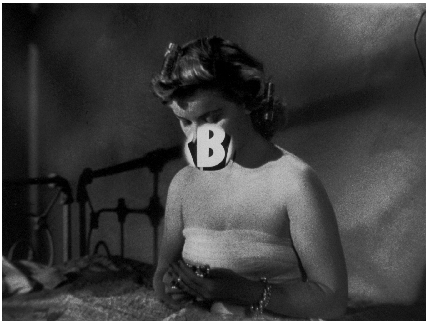
Starring3 (série: Annonces ), 1993, tirage argentique sur aluminium, 50 x 67 cm, © Éric Rondepierre