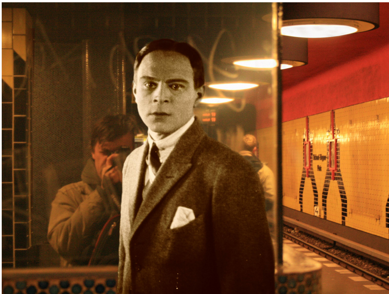
Photographie (série: Seuils ), 2008, Ilfochrome sur aluminium, 100 x 133 cm, © Éric Rondepierre